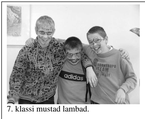
7. klassi mustad lambad.

Raido: Nii... mulle meeldis. Minu arust oli see selle kooliaasta kõige normaalsem päev. Õpilased olid väga tublid ja kuulasid ilusasti. Muidugi oli klassides ka musti lambaid, aga ma sain ka nendega kenasti